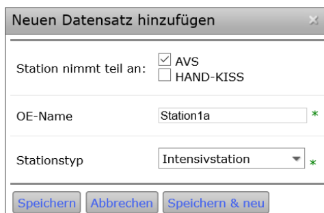
Abbildung 5: Neuanlage einer Station

Das weitere Vorgehen entspricht dem Wechsel der Kostenstellenzuordnung auf eine andere Station. Die Kostenstelle wird zunächst mit einem GueltigBis versehen. Dann ist die Kostenstelle ein weiteres Mal anzulegen, wobei die neue Station mit dem anderen Stationstyp ausgewählt und ein GueltigVon angegeben werden muss (Abbildung 6). Die angegebenen Gültigkeiten dürfen sich nicht überschneiden. Außerdem sollten die Gültigkeiten immer am Monatsletzten enden und am Monatsersten beginnen, da ansonsten vorhandene Belegungsdaten doppelt in die Daten eingehen.